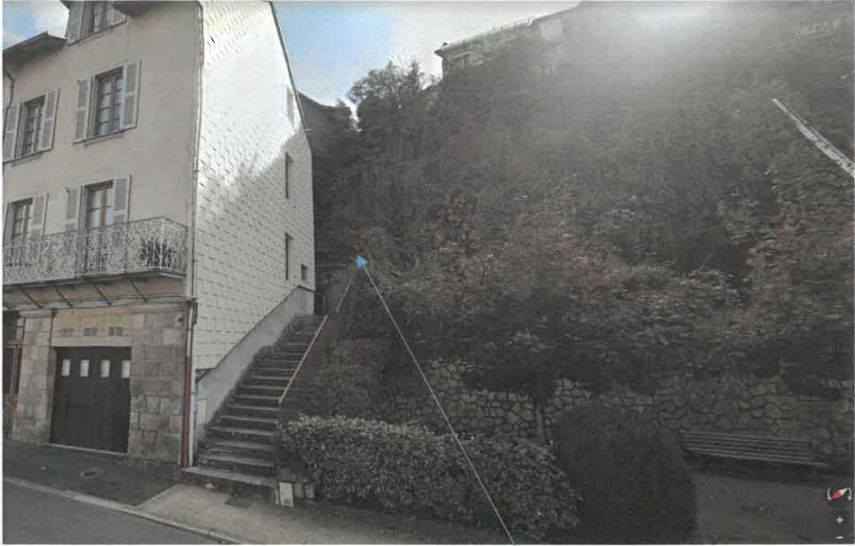
il s'agit d'une bande de terrain pentu, donnant en contrebas de la maison de m. Raymond