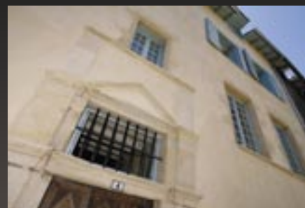
Au 4 rue du pas roulant, 5 logements vont être mis sur le marché locatif dans le courant du printemps.

8 immeubles sont actuellement en travaux, dont certains vont voir des mises en location dès le printemps, notamment sur trois immeubles de la rue de la Barrière et rue du Pas roulant.