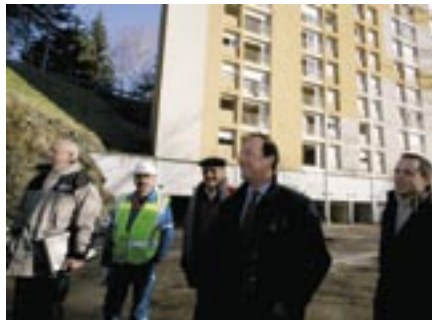
Première phase de déconstruction en cours pour la Gibrande. Visite du chantier par François Hollande, Jacques Marthon et Jean-Paul Deveix, élus, Gilbert Pinardon, directeur avec les entreprises intervenantes.

Parce qu'il faisait un peu figure « anachronique » dans le paysage du parc HLM municipal. Parce que sa position très excentrée avait petit à petit installé certains comportements inciviques. Parce que l'immeuble devenait de moins en moins convivial, Parce qu'il avait mal vieilli aussi malgré certaines réhabilitations et parce qu'il souffrait d'une réelle mauvaise réputation les locataires les plus sérieux l'ont petit à petit abandonné. Ainsi,