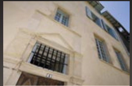
Au 4 rue du pas roulant, 5 logements vont être mis sur le marché locatif dans le courant du printemps.

8 immeubles sont actuellement en travaux, dont certains vont voir des mises en location dès le printemps, notamment sur trois immeubles de la rue de la Barrière et rue du Pas roulant.