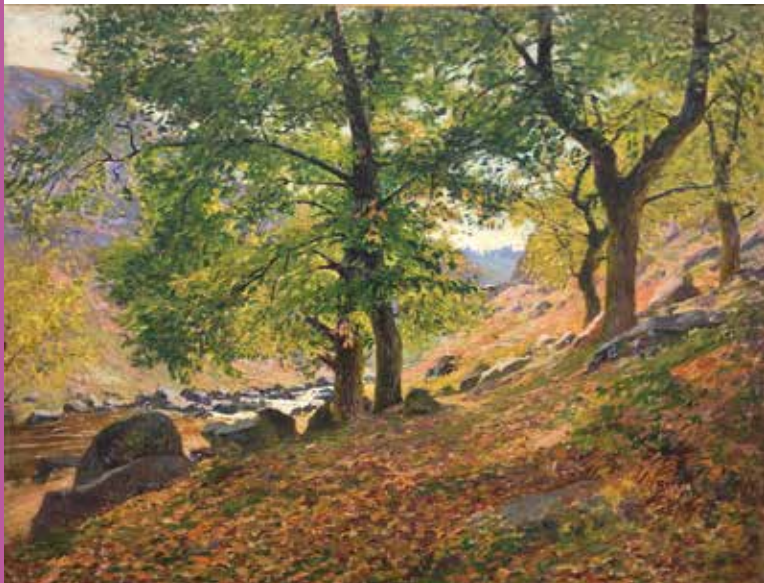
o Paul Madeline, Paysage de la Corrèze, 1904.