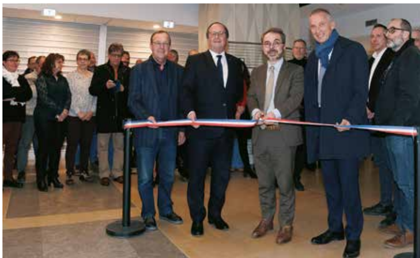
• Les travaux de la cité administrative ont été inaugurés le 31 janvier dernier par les autorités.

MAIRE DE TULLE, CONSEILLER DÉPARTEMENTAL