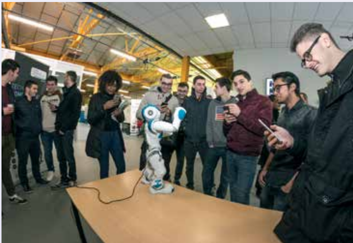
La 3 e édition de la « Journée industrielle » organisée par le CFAI avait pour thème « L'usine du futur ». Elle a permis aux apprentis et au grand public de découvrir de nouvelles technologies et l'industrie de demain. Nao, premier robot humanoïde a remporté un franc succès.