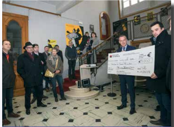
Grâce à ses barriques « Patrimoine durable », qui sont dépourvues d'emballage commercial, la société Brive Tonneliers a fait un don de 5 000 euros en faveur de la fondation « Tulle, un musée de la mémoire et du savoir-faire ».