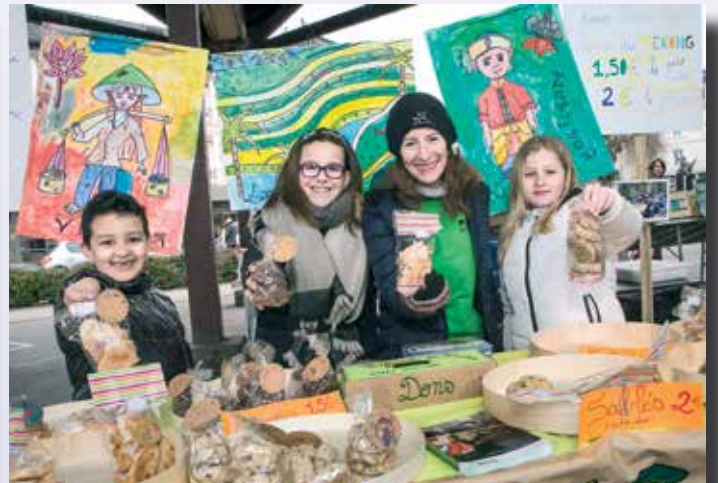
Les élèves de CE1 de l'école Joliot-Curie ont choisi de s'engager dans un projet solidaire. Ils ont préparé de nombreux gâteaux qu'ils ont vendus sur le marché de la gare. Les bénéfices ont été reversés à l'association « Enfants du Mékong » qui favorise l'accès à l'éducation des enfants de 7 pays de l'Asie du sud-est.