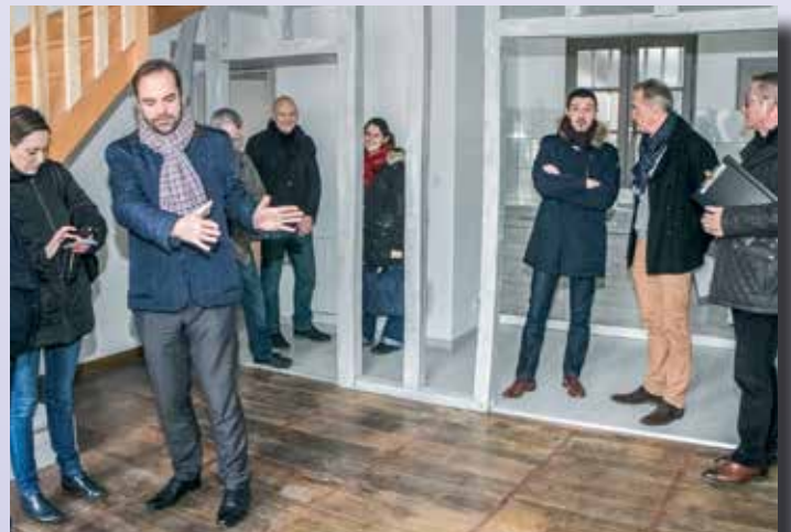
Au terme d'un an de travaux, une seconde vie commence pour l'immeuble du 85 rue de la Barrière. Lui qui était jusqu'alors inhabitable, propose désormais 4 beaux logements entièrement rénovés et accessibles grâce à une opération immobilière menée par la Ville et la société Territoires.