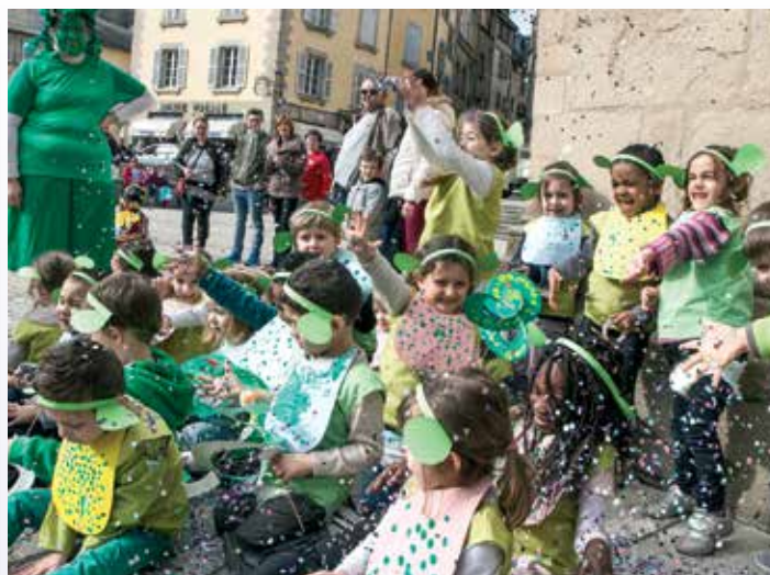
Près de 250 enfants des centres de loisirs de Tulle et de l'agglomération ont défilé dans le centre historique pour fêter le carnaval. Le joyeux cortège s'est ensuite arrêté sur le parvis de la cathédrale où chaque ALSH a fait brûler son totem de carnaval.