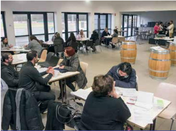
Le 3 février, une rencontre entre les entreprises et les demandeurs d'emploi était organisée par un groupe de stagiaires de l'INSUP. Les visiteurs ont pu y rencontrer une douzaine d'employeurs et agences d'intérim du bassin de Tulle.