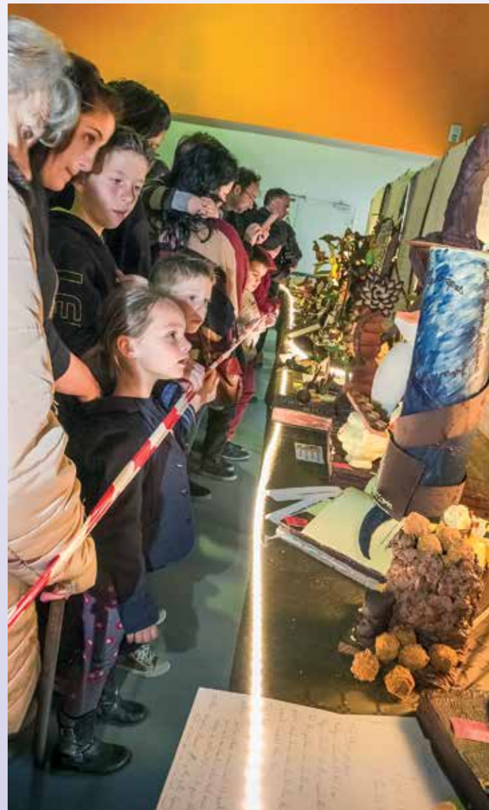
Chocorrèze, le 1 er salon du chocolat de la région s'est tenu lors du weekend du 18-19 mars dans la salle polyvalente de l'Auzelou. Les gourmands sont venus par milliers pour admirer le savoir-faire des meilleurs chocolatiers au cours de dégustations aussi surprenantes pour les yeux que pour les papilles.