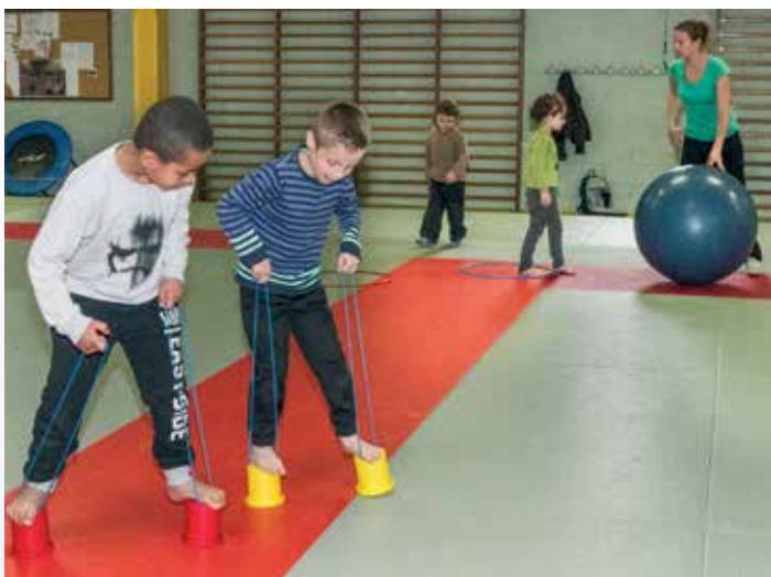
Un stage de cirque pendant les vacances ? C'est ce qu'a proposé l'association A'Tous Cirk aux enfants entre 4 et 14 ans qui ont pu s'initier aux arts du cirque à travers de nombreux ateliers.