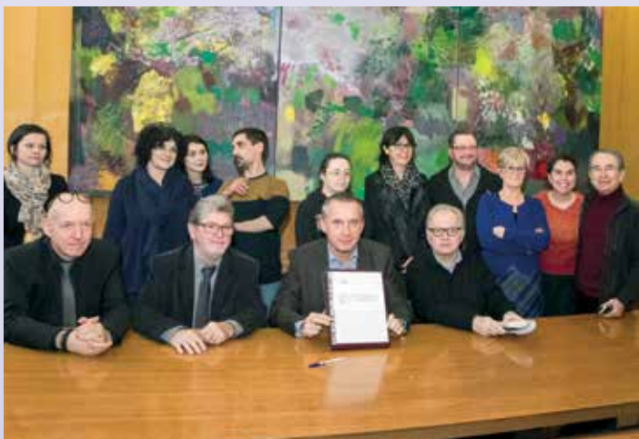
La Ville de Tulle et l'ADAPEI de la Corrèze sont partenaires depuis de nombreuses années pour favoriser l'insertion professionnelle des personnes handicapées. Elles viennent de signer une convention de partenariat permettant le suivi d'agents municipaux en situation de handicap.