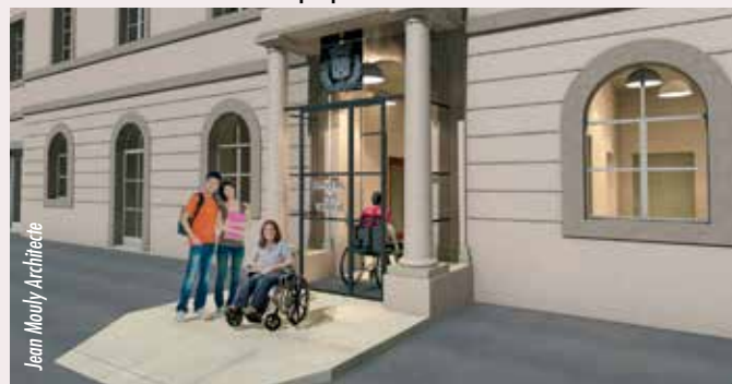
Jean Mouly Architecte

La plateforme d'accueil fait partie des grands chantiers de l'année puisqu'elle vous permettra bientôt d'effectuer 34 démarches administratives dans un seul et même lieu et en toute confidentialité. Entièrement accessible, ce lieu est pensé pour vous accueillir dans de meilleures conditions et de réduire votre temps d'attente. Les horaires d'accueil seront également adaptés, notamment avec une ouverture en continu jusqu'à 19h le mercredi.