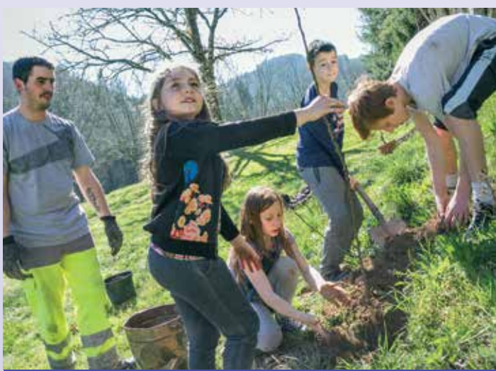
Les enfants du Centre de Loisirs ont planté des arbres fruitiers aux côtés des agents des services techniques. Pédagogie et sensibilisation à l'environnement étaient au cœur de cette action.