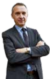
BERNARD COMBES, MAIRE DE TULLE, CONSEILLER DÉPARTEMENTAL

Les difficultés du printemps de confinement commençaient à s'apaiser. La Ville et Tulle agglomération avaient attribué l'essentiel des aides aux commerces et entreprises qui avaient été paralysés ou gravement touchés par la crise sanitaire.